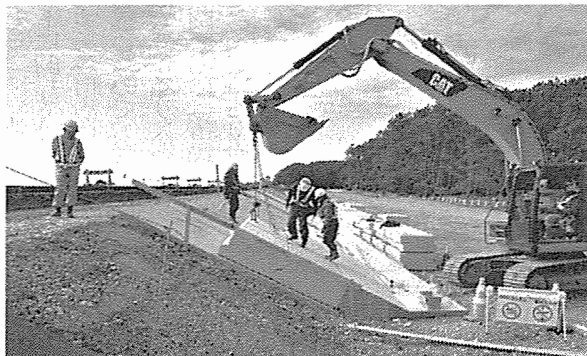
ブロック据付状況

働き方改革にも取り組み、週休2日を目指しています。作業効率を高め、クリティカルパスを見極め、「ムリ・ムラ・ムダ」を無くし、明るい希望が持てる現場にしたいです。今後も地域住民の皆さまが安心して暮らせるよう配慮して工事を進めていきます。